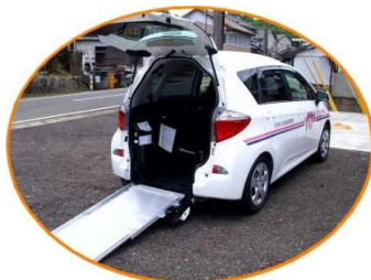
車椅子を使用される方も 安心の送迎車

鹿島市にお住まいの方で、 介護保険証をお持ちの方 ※鹿島市以外にお住まいの方も ご相談下さい。