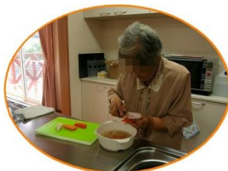
スタッフと一緒に食事作り