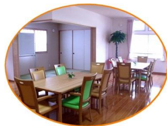
日差しが入り明るいフロアー