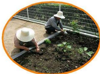
ゆうあい古枝菜園