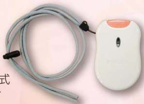
ペンダント式 通報ボタン